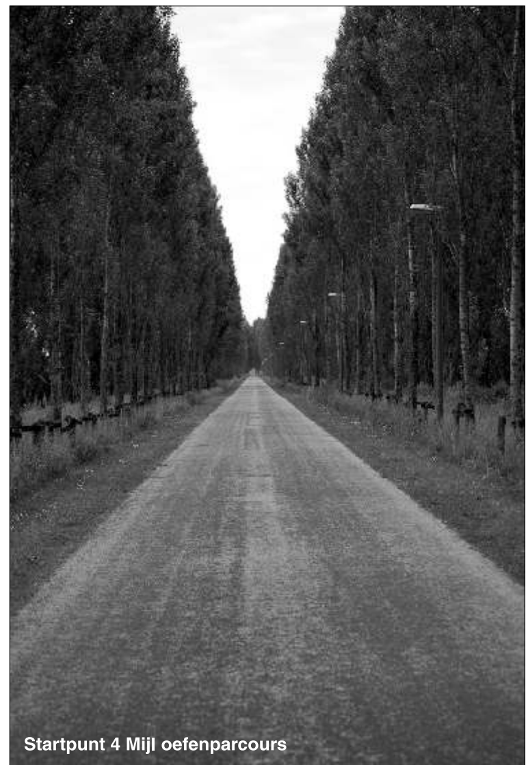
Startpunt 4 Mijl oefenparcours

Uiteindelijk moet dit 4 mijl hardloopcircuit al die elementen van sport, natuur, gezondheid en sociale binding bij elkaar samenbrengen.